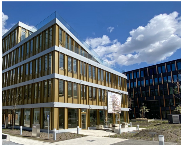
NÄV-Immobilie im Direktbestand: Godesberger Allee 140, Bonn